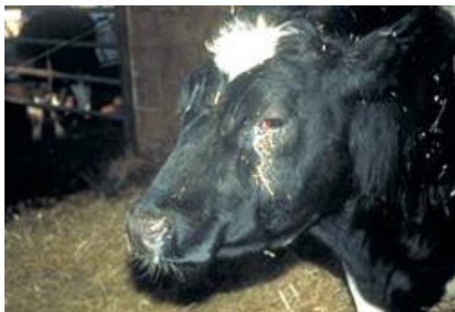
Kreatur med akut øjenbetændelse

Under et sådant forløb er det vigtigt at kunne få støtte og hjælp til praktiske ting. Kontakt gerne SEGES' veterinære beredskab for Kvæg .