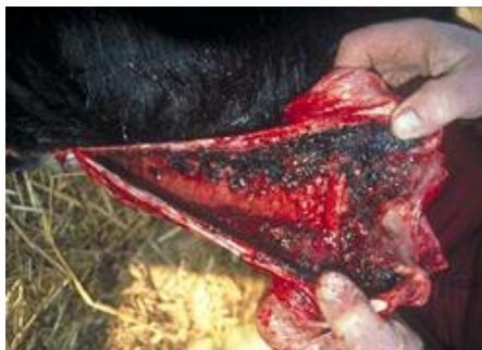
Luftrøret hos et dyr med akut IBR er blevet skåret op, og der ses blødninger som følge af sygdommen.